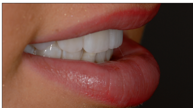
Foto 7. Eindresultaat.