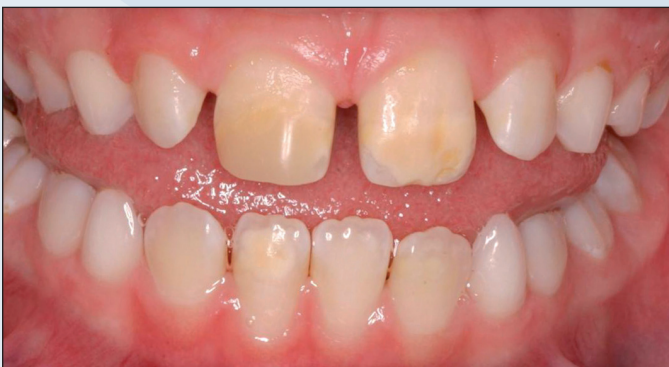
Foto 1. Situatie voor de behandeling.

Op het laboratorium zijn de afdrukken uitgegoten en de gips stompjes zijn gedupliceerd in vuurvaste stomp materiaal van Cosmotech. Op het vuurvaste materiaal is Antagon interaction veldspaat keramiek gebakken.