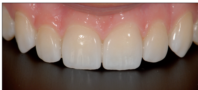
Foto 5. Eindresultaat.