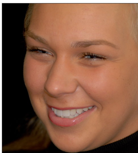
Foto 10. Portret.