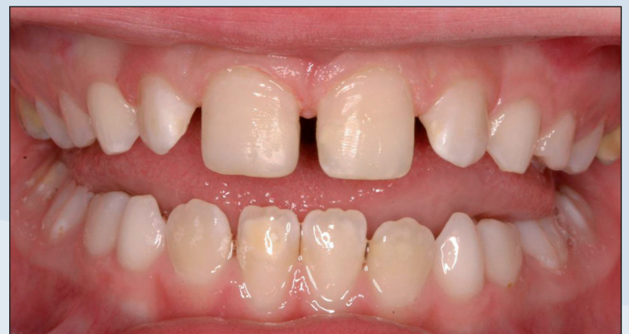
Foto 2. De 2.1. en 1.1. zijn oppervlakkig beslepen en gevuld met composiet.