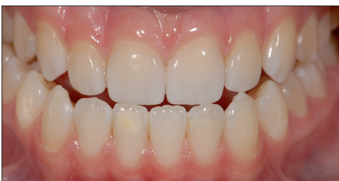
Foto 9. Eindresultaat.