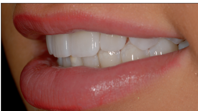
Foto 6. Eindresultaat.