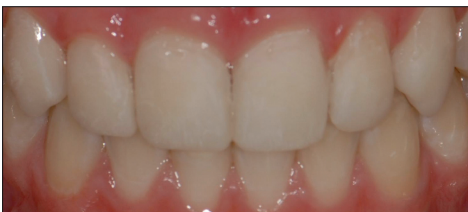
Foto 4. Tijdelijke kunsthars facings.